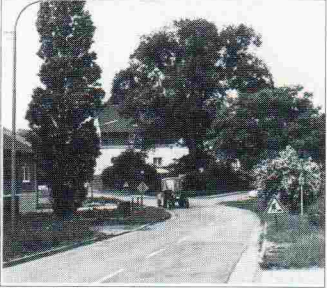
Natur im Dorf